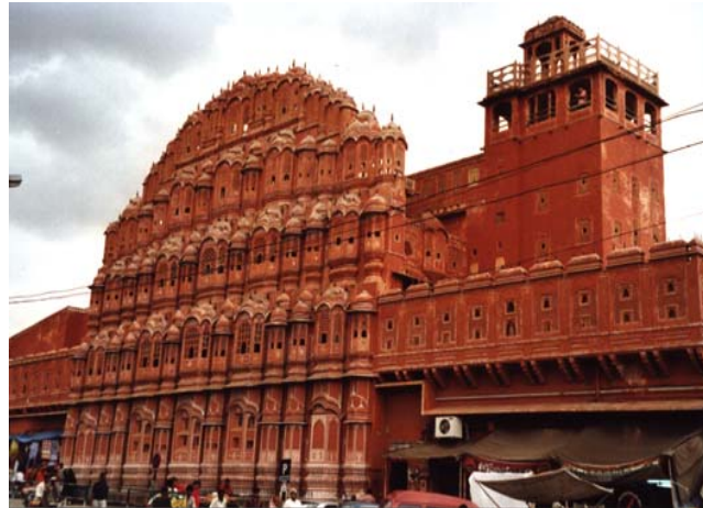
Palast der Winde - Jaipur