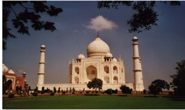
Taj Mahal - Agra